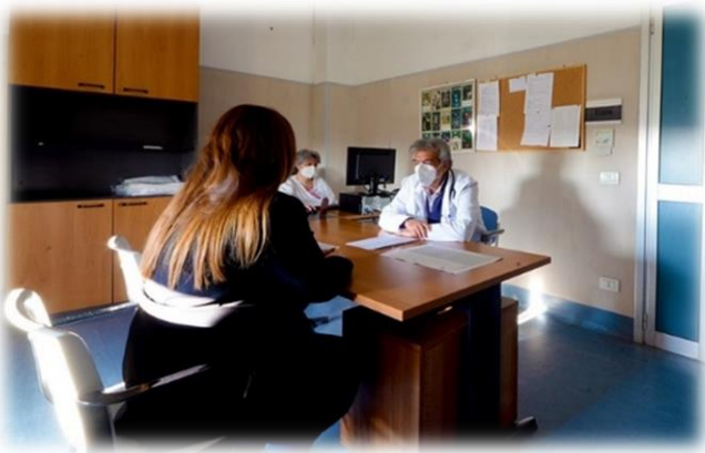
U.O. Lungodegenza (Cod.60)