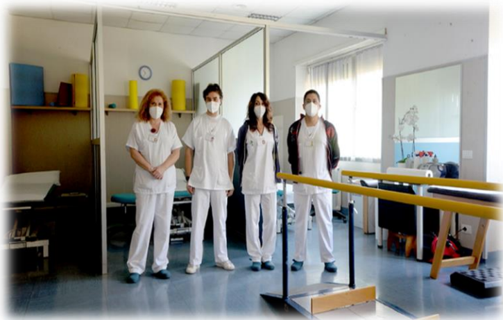
U.O. Day Hospital (Cod.56)

Le funzioni del Day Hospital sono rivolte principalmente a pazienti con patologie e disabilità che non necessitano di ricovero ospedaliero, ma che ostacolano la gestione delle attività di vita quotidiana.