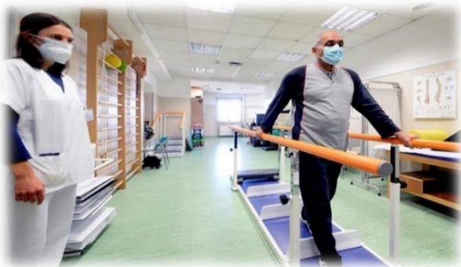
U.O. Riabilitazione Ospedaliera (Cod.56)

Le prestazioni riabilitative offerte sono le seguenti: